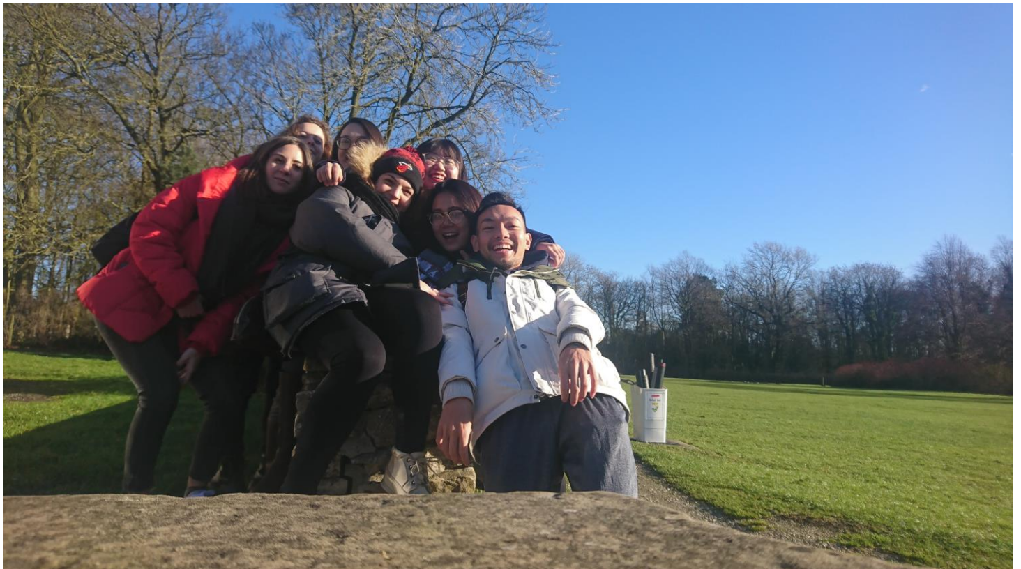
NTU IB dual degree students mountaineering teambuilding activity