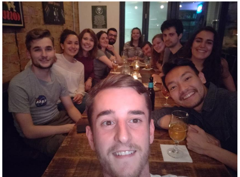
A post-exam celebration with housemates