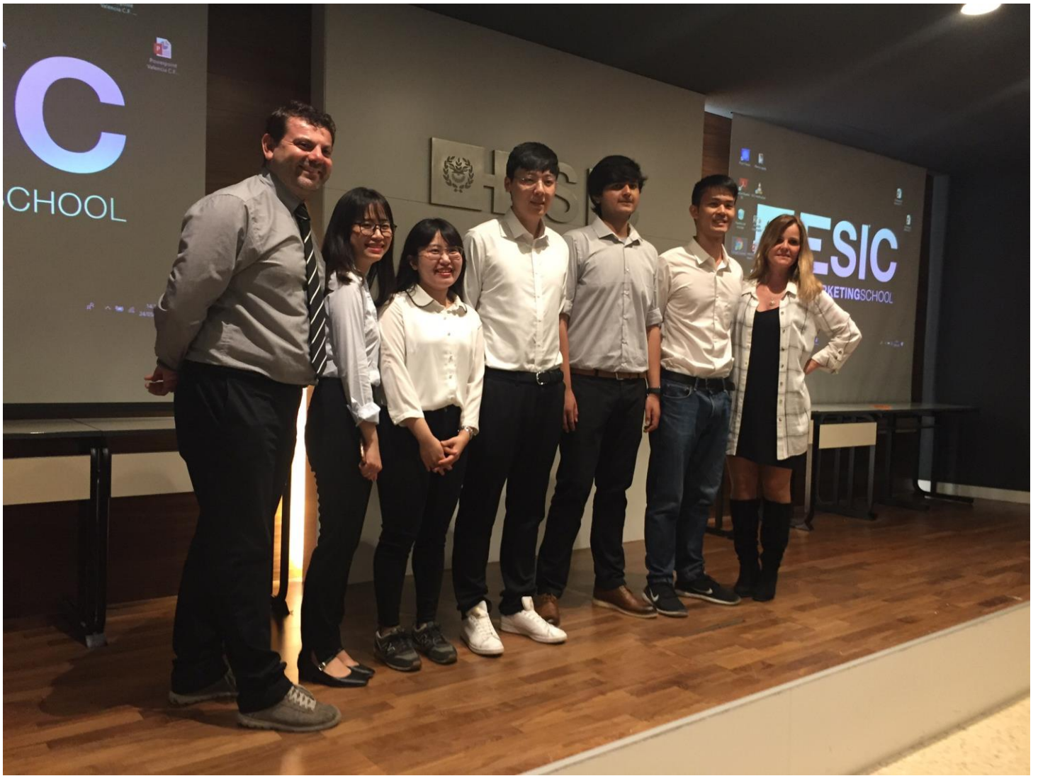
Valencia consulting project final presentation