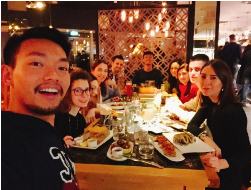
A chill-out dinner with classmates